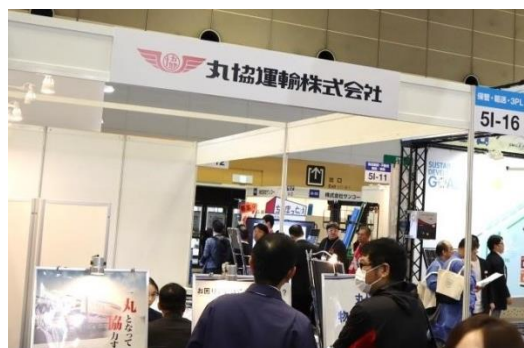
第1回関西物流展の様子

(第2回関西物流展 Covid-19 本展のコロナ対策 https://kansai-logix.com/covid/ )